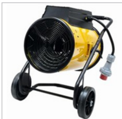
Générateur d'air chaud GEB 40