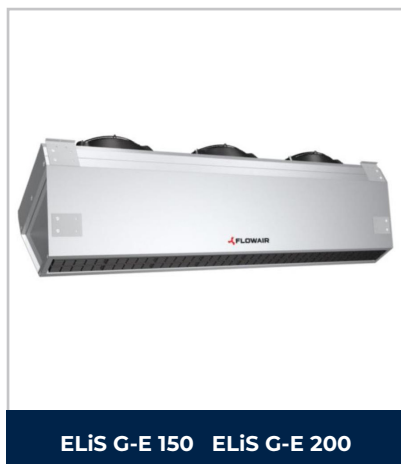
ELIS G-E 150 ELIS G-E 200

Les rideaux d'air chaud électriques industriels FLOWAIR de la gamme ELIS G sont équipés de batteries électriques performantes qui chauffent l'air par un ventilateur à vitesse variable. Ces appareils sont conçus pour fonctionner à l'intérieur et peuvent être montés horizontalement ou verticalement. Idéal pour protéger les entrées d'air froid d'une porte sectionnelle de hauteur maxi de 7 m.