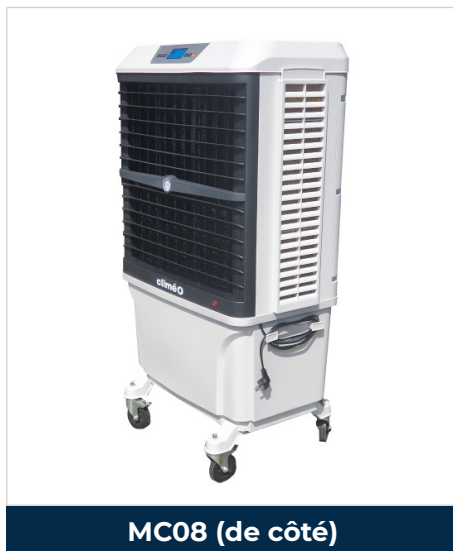
MC08 (de côté)