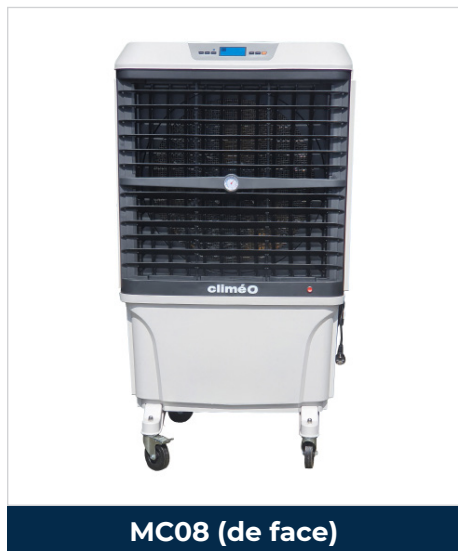
MC08 (de face)

Compacts et efficaces, les rafraichisseurs CLIMEO MC08 sont conçus pour les locaux de moyennes et grandes dimensions. Ils assurent une baisse de la température ambiante par l'action naturelle de l'eau et produisent un climat intérieur confortable en optimisant la température et l'hygrométrie.