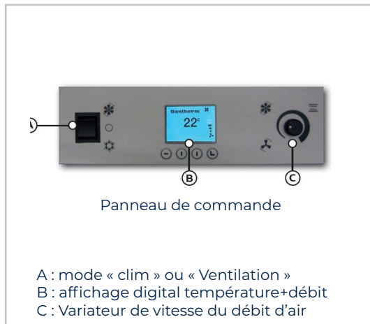
Panneau de commande

A : mode « clim » ou « Ventilation » B : affichage digital température+débit C : Variateur de vitesse du débit d'air