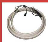
Flexibles de 5 ou 15 mètres