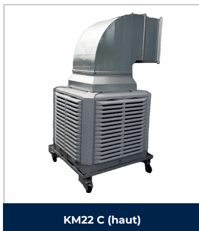
KM22 C (haut)

La gamme KM des rafraichisseurs d'air comporte 3 modèles de 22000 à 32000 m 3 /h qui vous permettront de rafraichir des locaux de grands volumes. Consommation en eau et électricité minimale. Idéal pour l'industrie et l'événementiel en alternative à la climatisation industrielle.